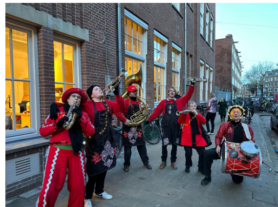
Fanfare tijdens de opening

De deuren gaan om 08.15 uur open. Om 08.30 uur moeten de kinderen in de klas zitten. Dus als je kind om 08.29 uur beneden de schooldeur binnen loopt dan is het te laat. Ik weet dat het jufferig klinkt en ik realiseer me ook dat het niet altijd makkelijk is om het voor elkaar te krijgen. En er zullen altijd momenten blijven dat het niet lukt. Maar als je echt vaak te laat komt dan is het handig om even te overleggen wat we als school kunnen doen om te zorgen dat het op tijd komen wel lukt. Want laatkomers missen info en storen de klas.